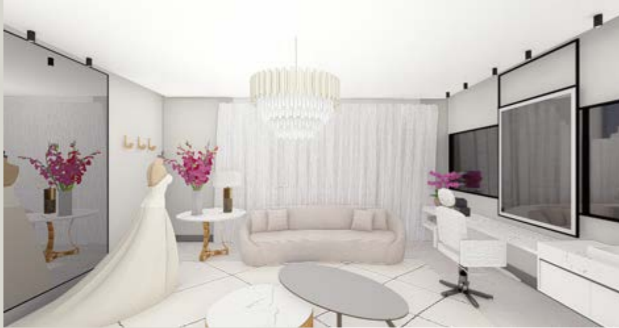
SALA DA NOIVA